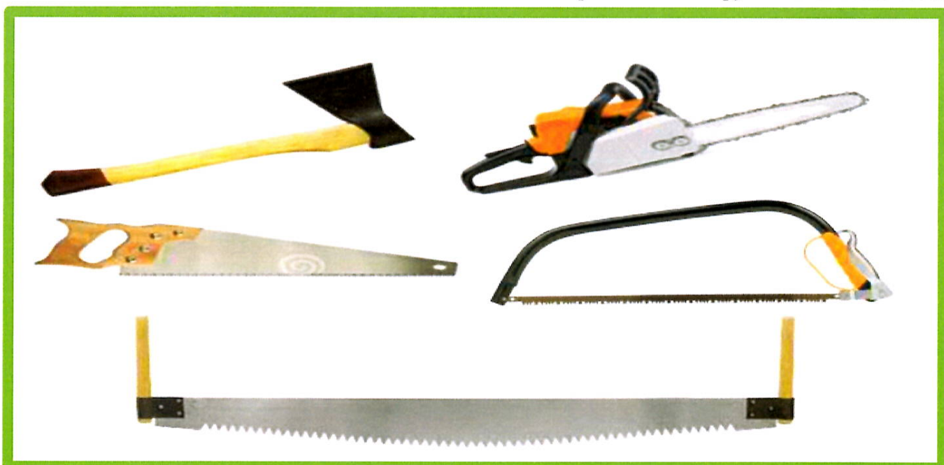
Изображение № 8 Разрешенные инструменты для заготовки

При заготовке валежника допускается применение ручного инструмента (ручных пил, топоров, бензопил) ( смотри изображение 8 ).