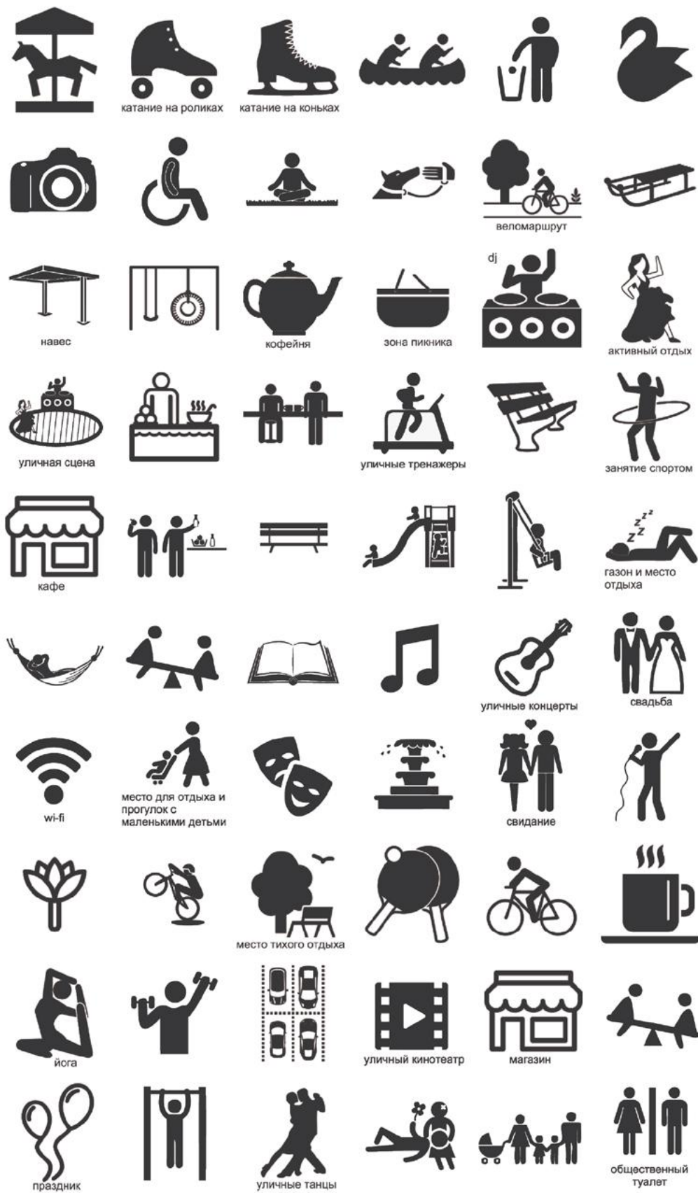
Пример набора значков для проведения дизайн-игры, используемых для работы с картой