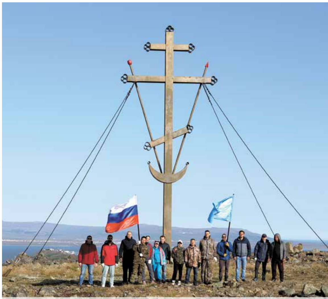
Ко Дню Государственного флага в Анадыре провели экологическую акцию на сопке Святого Михаила

Также во всех пожарно-спасательных гарнизонах, отрядах федеральной противопожарной службы, пожарно-спасательных частях края прошли торжественные построения с поднятием триколора и занятия с личным со-