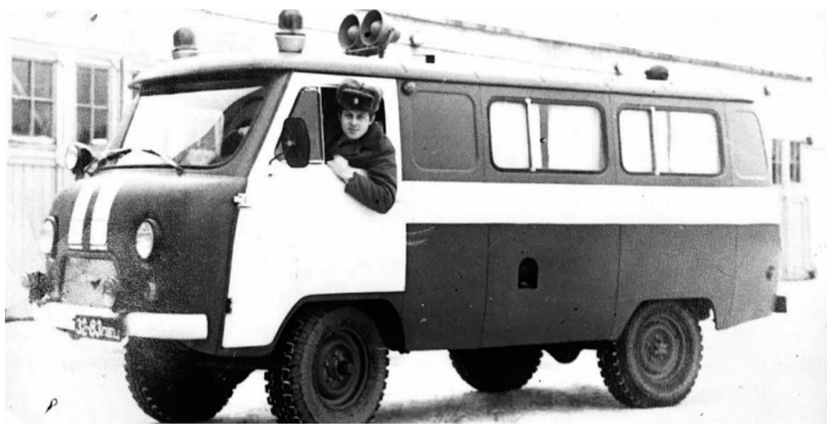
Основатель пожарной династии Геннадий Якушов перед выездом на очередной вызов

Общий стаж службы династии Якушовых-Чертилиных из Специального управления ФПС № 22 МЧС России составляет 43 года