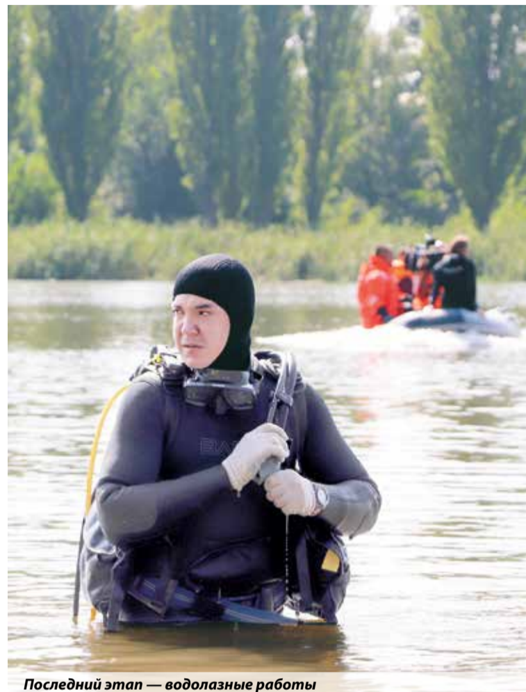
Последний этап — водолазные работы

Третий, заключительный день начался с ознакомления с местом базирования спасателей Северо-Кавказского РПСО МЧС России. Затем все переместились на ближайшую гору для отработки заданий по выполнению элементов аварийно-спасательных работ в горной местности.