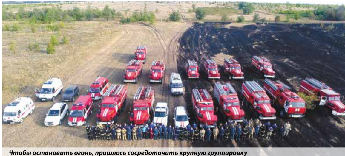
Чтобы остановить огонь, пришлось сосредоточить крупную группировку

Сильнейшие порывы ветра молниеносно разносили искры по округе. Огонь, бушевавший в лесном массиве, все