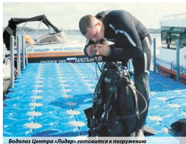
Водолаз Центра «Лидер» готовится к погружению