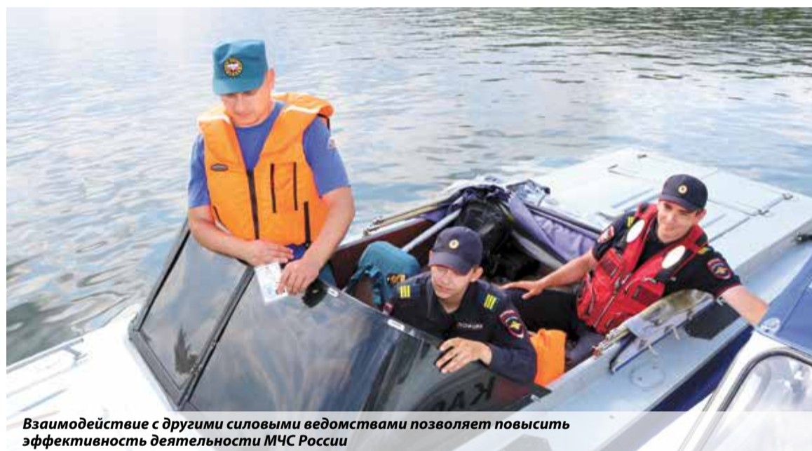
Взаимодействие с другими силовыми ведомствами позволяет повысить эффективность деятельности МЧС России

Две смешанные команды отправляются вверх по течению Томи. Задача «Амура», идущего в авангарде, — фиксация правонарушений. Наш катер на подхвате, мы снимаем работу коллег на фото и видео.