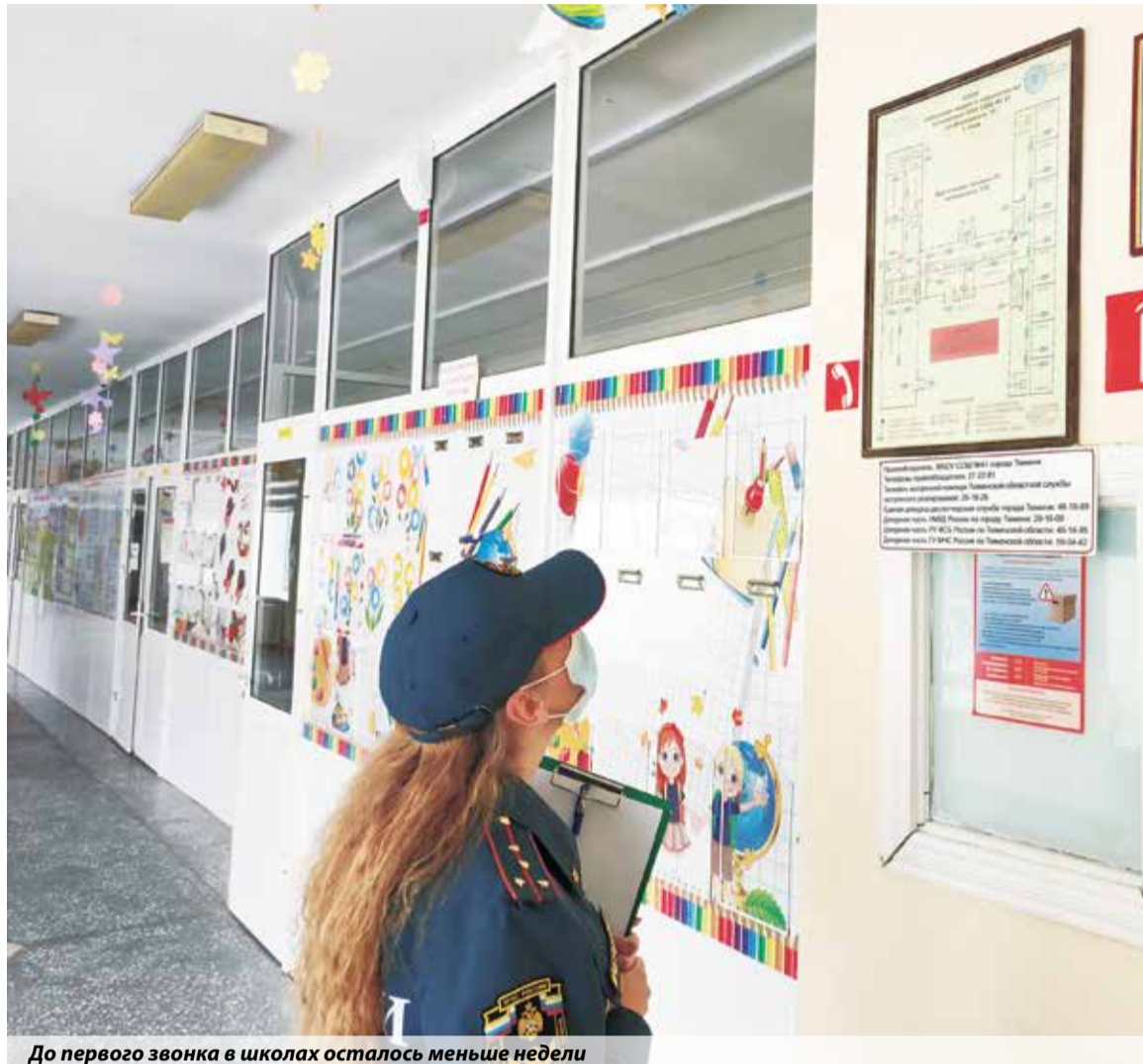
До первого звонка в школах осталось меньше недели

Также была проверена работа автоматической пожарной сигнализации. Для этого пришлось нажать одну из тревожных кнопок, чтобы сы-