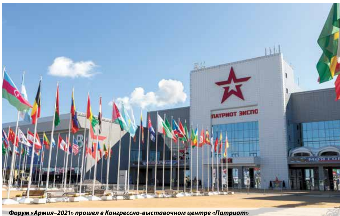
Форум «Армия–2021» прошел в Конгрессно-выставочном центре «Патриот»

Тема психологического просвещения сегодня особо актуальна, но, увы, мало кто задумывается о поддержании своего психологического благополучия. А ведь именно базовые знания психологии помогают человеку адекватно реагировать на быстро изменяющийся мир и справляться с многочисленными вызовами современной жизни. Как сохранить свое психическое здоровье, реализовывать свои способно-