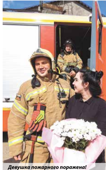
Девушка пожарного поражена!

— Не каждый день у товарища такая просьба. Все получилось, как задумывали. Самое главное — спасибо руководящему составу, который позволил это сделать. Хорошо, не было вызовов. Хочу пожелать Валенти-