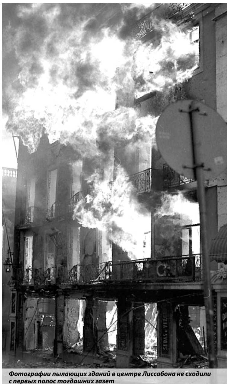
Фотографии пылающих зданий в центре Лиссабона не сходили с первых полос тогдашних газет

— С этими гидрантами, установленными посреди улицы, можно легко потушить пожар в мусорном баке, но невозможно в здании, — охарактеризовал ситуацию один из огнеборцев, участвовавших в тушении.