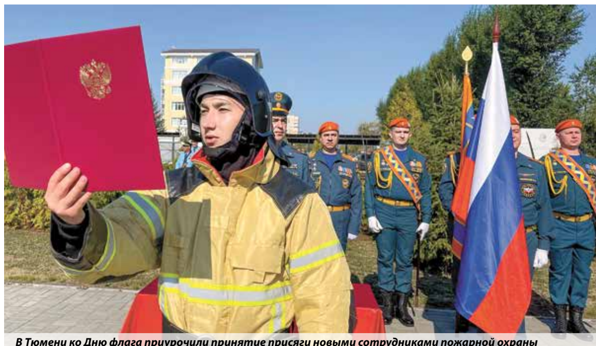
В Тюмени ко Дню флага приурочили принятие присяги новыми сотрудниками пожарной охраны

Виктор Жестков, по материалам региональных пресс-служб