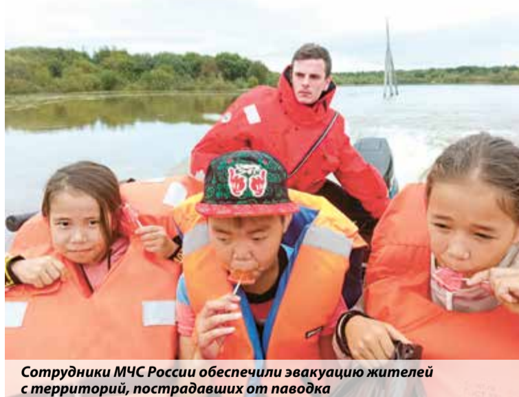
Сотрудники МЧС России обеспечили эвакуацию жителей с территорий, пострадавших от паводка

В Хабаровске на островах Большой Уссурийский, Дачный, Кабельный подтоплено 1399 дачных участков. При этом многие жители не спе-