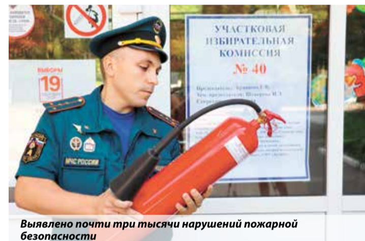
Выявлено почти три тысячи нарушений пожарной безопасности