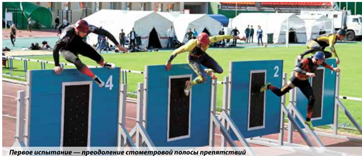
Первое испытание — преодоление стеновой полосы препятствий

Во Владимире за звание лучших боролись 15 команд спецподразделений МЧС России