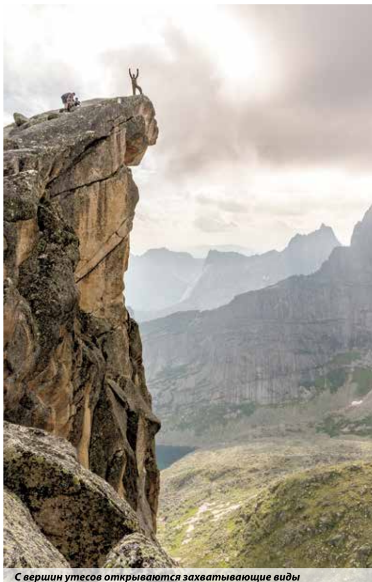
С вершин утесов открываются захватывающие виды

Подготовила Екатерина Леонардова, пресс-служба ГУ МЧС России по Красноярскому краю