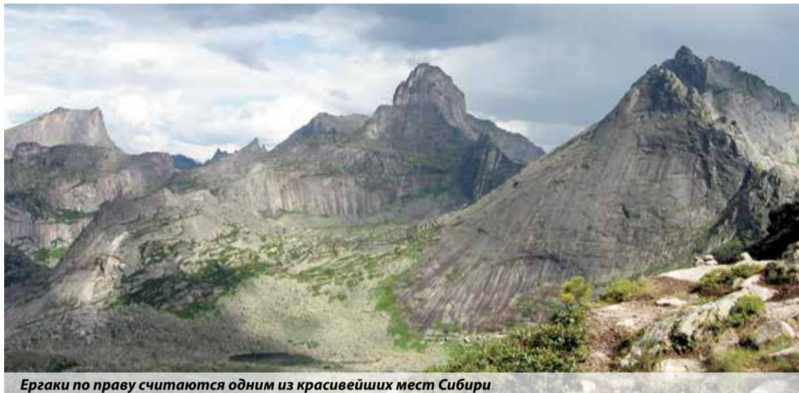
Ергаки по праву считаются одним из красивейших мест Сибири

Ергаки — очень красивое место. Там чистейшие озера, вода в них кристальная. Правда, купаться в них дело не самое приятное. Они очень холодные, в июле вода прогревается максимум до 18 градусов.