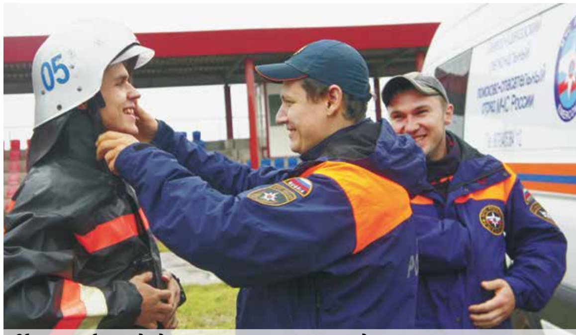
Облечься в боевую одежду пожарного — это только начало задания

Такую возможность журналистам предоставили в Ставропольском крае